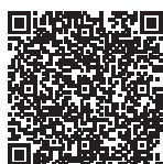
ABB Ability™ SmartTracker

Su richiesta, ABB prevede soluzioni manutentive anche durante il periodo di garanzia, prevedendo la manutenzione ordinaria e tempi di intervento definiti contrattualmente in caso di guasto.